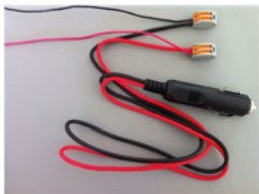
Branchement allume cigare*